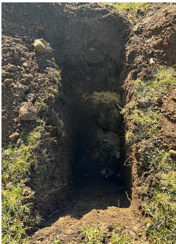
Figur 5-1. Visar ferrokalk i provgropen som rasat ner i botten av gropen.

För en mer detaljerad redogörelse av jordlagerföljder, provnivåer i respektive provpunkt, se fältprotokoll för jord i Bilaga 2.