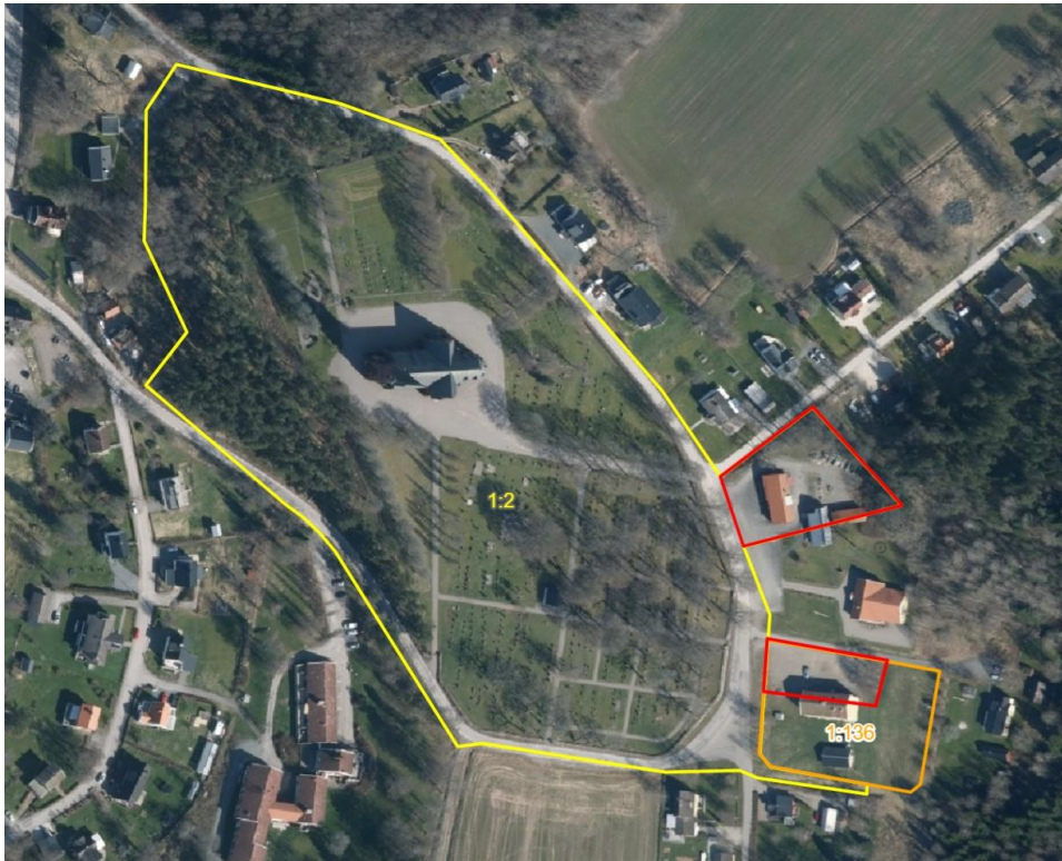
Figur 2-1. Översiktsbild över fastigheten, gula linjen visar hela fastigheten. Den röda visar undersökningsområdet.