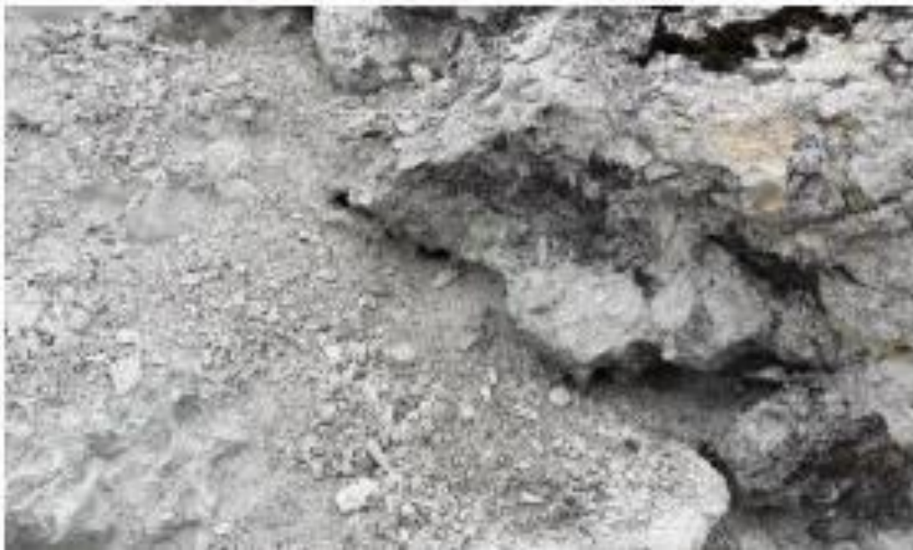
Figur 2-4. Bilden visar hur ferrokalk eller vit ferrokromslag kan se ut.