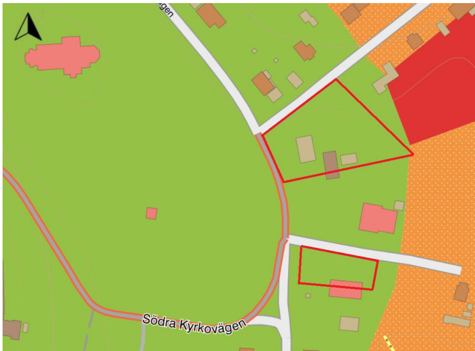
Figur 2-2. Jordarter inom undersökningsområdet. Grön=isälvsediment, orange med prickar=postglacial sand och röd=berg.

Enligt SGU:s jordartskarta består undersökningsområdet av isälvsediment, se Figur 2-2. Berg påträffas mellan 3-5 m under markytan enligt bergdjupskarta framtagen av SGU (SGU, 2026).