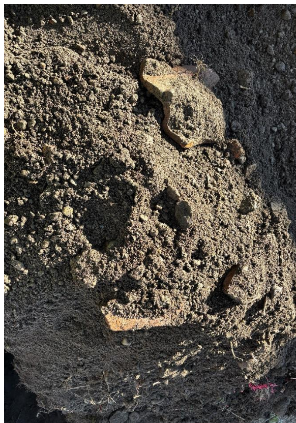
Figur 5-1. Bilden visar tegelskärvor som grävdes upp (Foto: Rejlers).