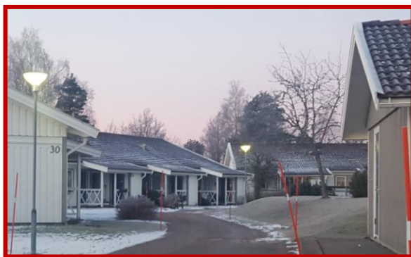
Befintlig bebyggelse vid Håvesten

Ungefärligt område för planlagda flerfamiljshus